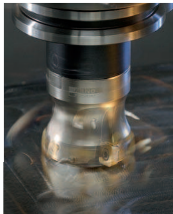
Инструменты и сменные пластины для фрезерной обработки и резьбофрезерования