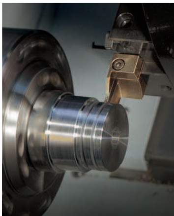
Инструменты и сменные пластины для отрезки и обработки канавок