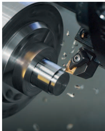
Инструменты и сменные пластины для токарной обработки и обработки резьбы